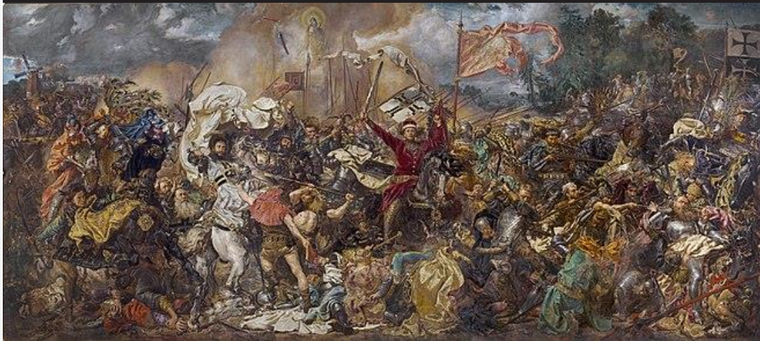
Jan Matejko, Bitwa pod Grunwaldem , 1872–1878